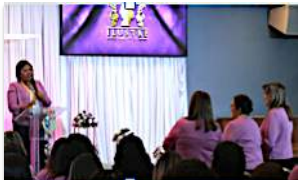
Retiro das Mulheres