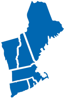
New England Area Map

Já se passaram mais de 168 anos, desde que o grande evangelista Dwight Moody entregou sua vida para Cristo, dentro de uma sapataria na cidade de Boston, MA. A partir de então, ele se tornou um dos maiores ganhadores de almas na história da nação americana. Aquele que convenceu ao jovem Moody a render sua vida a Cristo, o bondoso Espírito Santo, ainda continua operando nos corações das pessoas aqui na região de Boston. O Senhor nosso Deus tem levantado novos missionários para continuar a obra que Moody e tantos outros evangelistas e pastores fizeram para o Reino de Deus, na Nova Inglaterra.