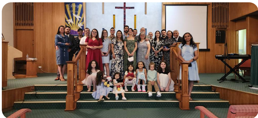
Congregação em Sidney