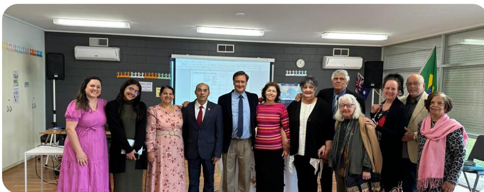
Congregação em Melbourne