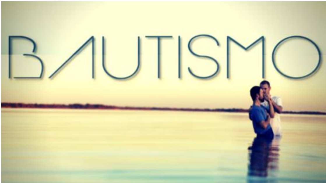
video DE BAUTISMOS CDL

La iglesia protestante en general, con algunas excepciones, reconoce solamente dos sacramentos como instituidos por el Señor Jesucristo para ser observados por toda la iglesia: El Bautismo y La Comunión (Santa Cena).