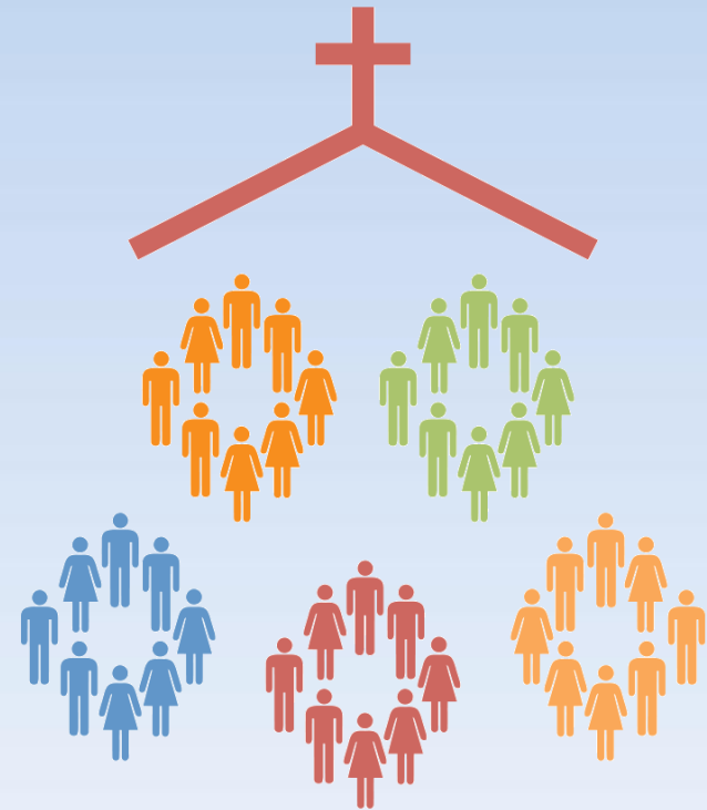
IGLESIA DE GRUPOS