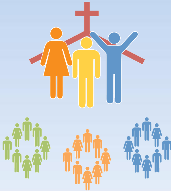
IGLESIA CON GRUPOS