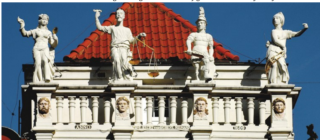
Złota Kamienica na Długim Targu w Gdańsku z figurami cnót kardynalnych