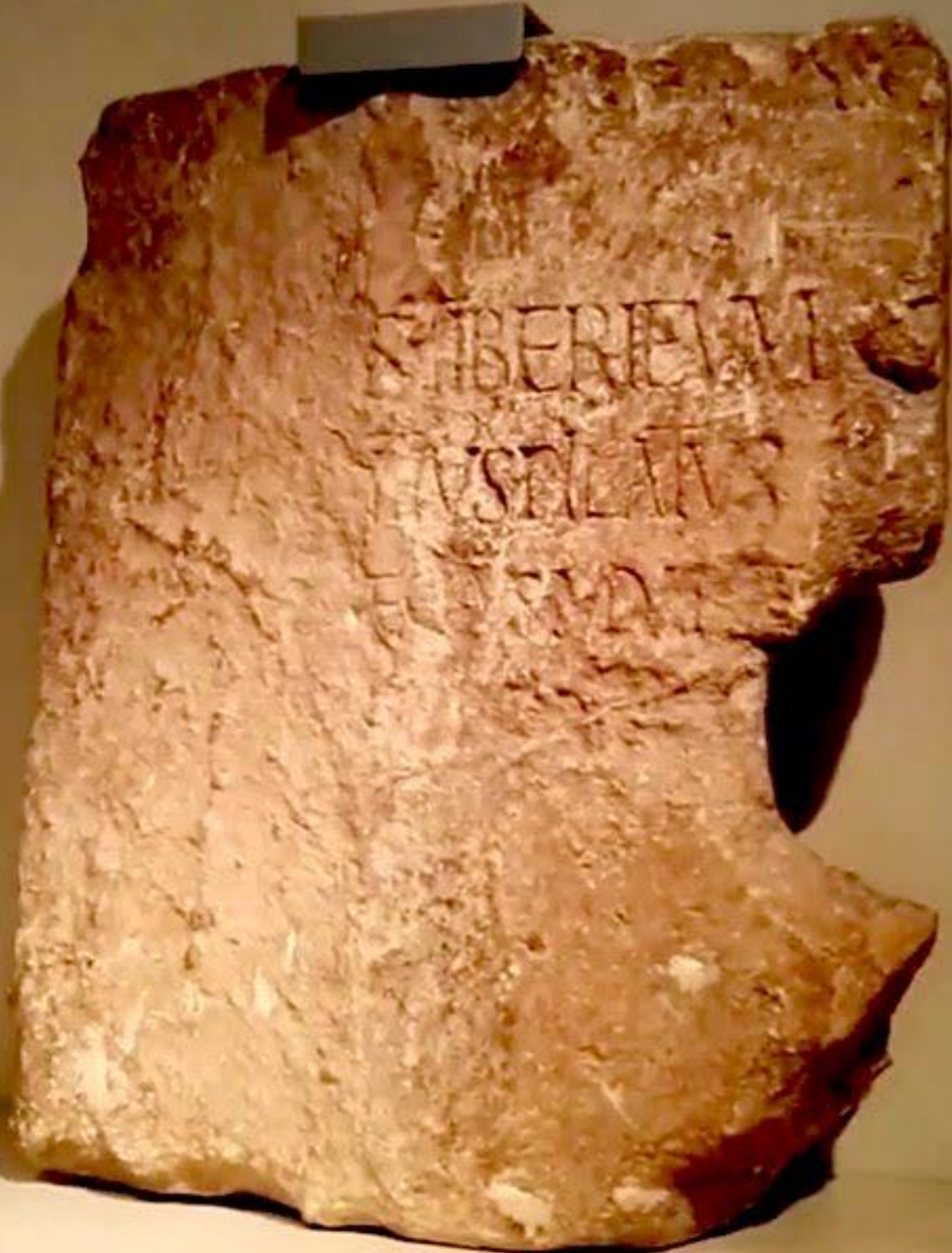
המסר הרומאי למסר / המסר ההיבדי / המסר ההיסקל התקר 12 קיל המלא, מטר 20 מלמה

מסמך זה הוא תרגום של המסמך המקורי, המצוי במוזיאון הבריטן, לונדון. המסמך המקורי הוא כתובת אבן, המצויה במוזיאון הבריטן, לונדון. המסמך המקורי הוא כתובת אבן, המצויה במוזיאון הבריטן, לונדון.