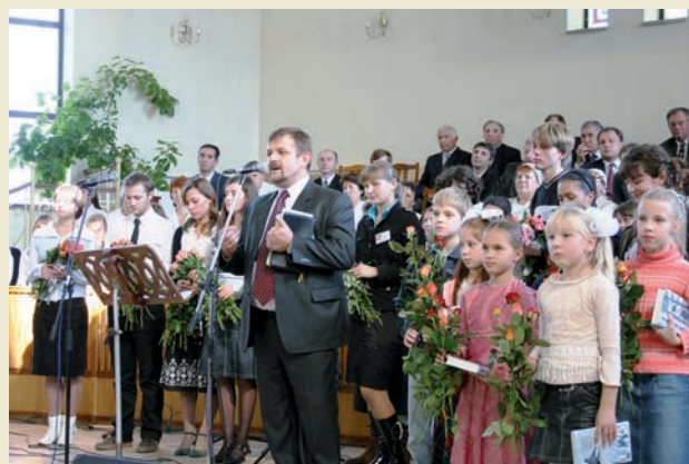
Цветы страдавшим за Христа