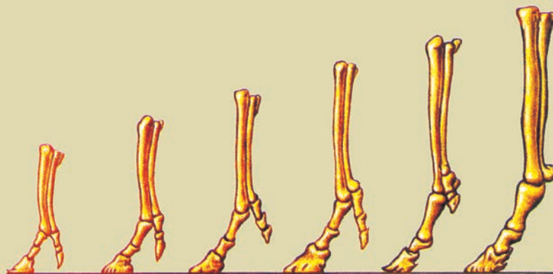
Рис. 55. Исторический ряд изменений в строении передней конечности лошади

«Биогеографические доказательства эволюции». Если прочесть данный подраздел цитируемого учебника по биологии (стр. 154), то становится ясно, что авто-