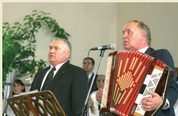
Богата талантами Украина