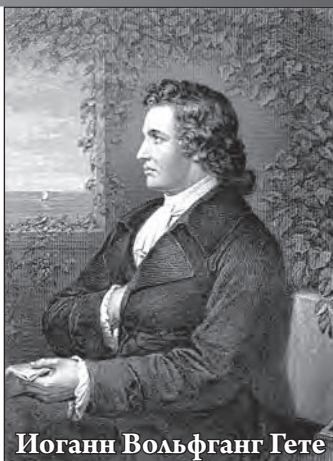
Иоганн Вольфганг Гете

«Я изучил Библию, как говорится, и вдоль и поперек; и по частям, и в целости. Строгая естественность Ветхого Завета и нужная откровенность Нового привлекали меня в особенности. В общем, Библия не возбуждала моего сомнения ни в чём... Я настолько сроднился душою с этой книгой, что не мог когда-либо вновь отшатнуться от нее. Я был защищен