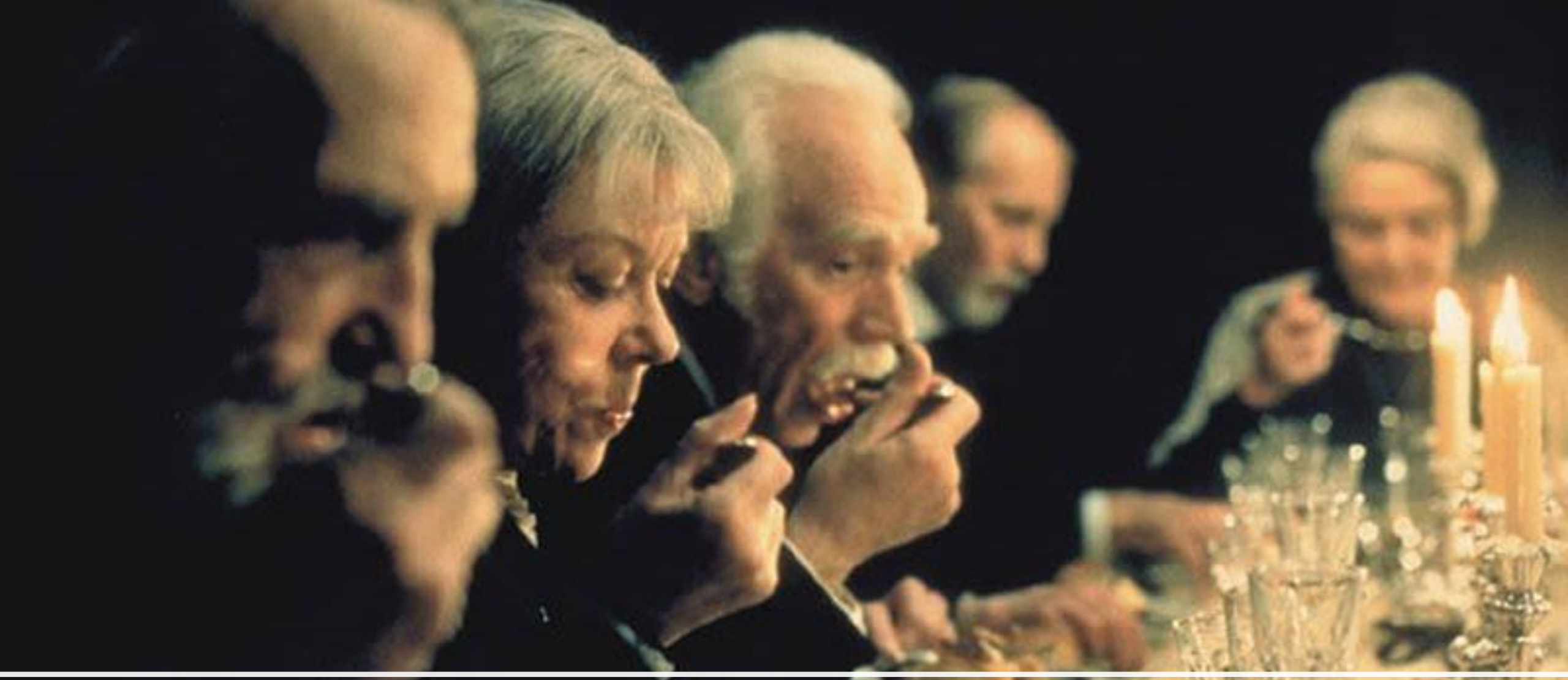
Babette's Feast 《芭比的盛宴》